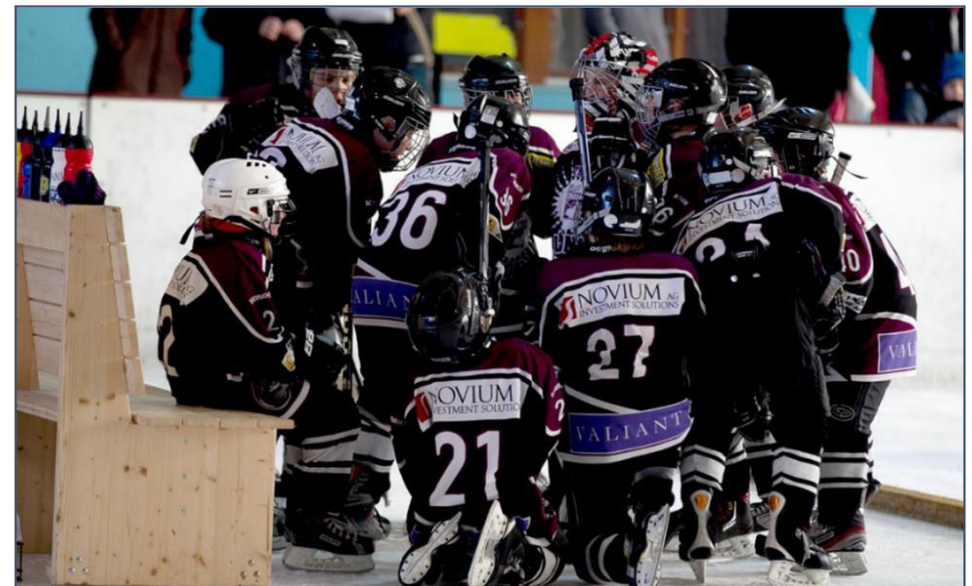
Piccolo Team bei der Team-Besprechung